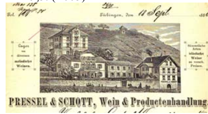
Abbildung der Geschäftshäuser vor Weinbergen. Rechter Rand mit winzigen Fehlstellen, gegilbt, Knickfalten. Format: 22x29,5. (E005)