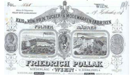
Abbildung der Fabrikanlagen in Fulnek und Fulner, Trade-Mark, Medaillen, aufgeklebter K.K. Stempel-Marke über 5 Kreuzer. Knickfalten, gering fleckig, kleine Abheftlochungen. Format: 28,5x22. (E001)