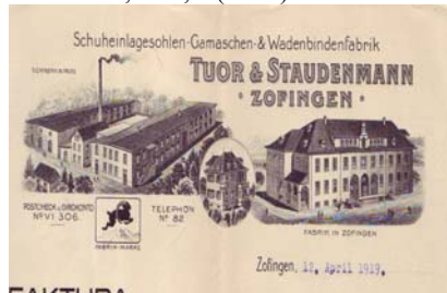
Los 636 Ausruf: 12 € Zofingen: Tuor & Staudenmann, Spezialfabrik für Schuheinlegesohlen Wadenbinden, 1924

Factura mit Abbildung des Geschäftshauses, der Fabriken in Truns u. Zofingen, Fabrik-Marke. Knickfalten, gering fleckig. Format: 27,5x21,5. (E001)