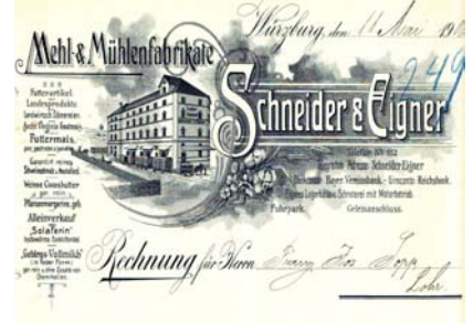
Abbildung des Hochlagers, davor Fuhrwagen und Waggons. Abheftlochungen, Knickfalten, gering fleckig. Format: 28,5x22. (E001)

Los 629 Ausruf: 13 € Würzburg. Wilhelm Stein, G. Hauer Nachfolger; Weissigfabrik 1906