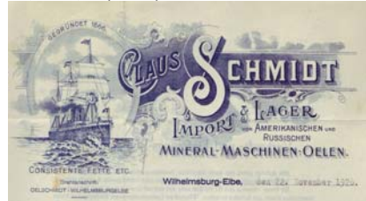
Abbildung eines Dreimast-Handelschiffes im Hintergrund Leuchtturm. Knickfalten, gering fleckig, Abheftlöcher. Format: 28,5x21,5. (E001)

Los 626 Ausruf: 15 € Windsheim, Carl Seefrid, Kolonialwaren/Textilien, 1849