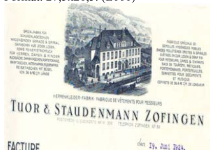
Los 638 Ausruf: 11 € Zofingen: Aktiengesellschaft vormal- s Tuor & Staudenmann, Spezi- alfabrik für Schuheinlegesohlen Wadenbinden, 1932

Zweisprachige (deutsch/franz.) Factura mit Abbildung der Fabriken in Truns u. Zofingen. Knickfalten, gering fleckig. Format: 27,5x21,5. (E001)