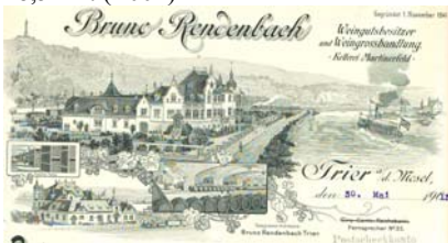
Abbildung des Weingutes, davor Moselpanorama, Innenansichten. Abheftlochungen, Knickfalten, gering fleckig. Format: 28,5x22. (E001)