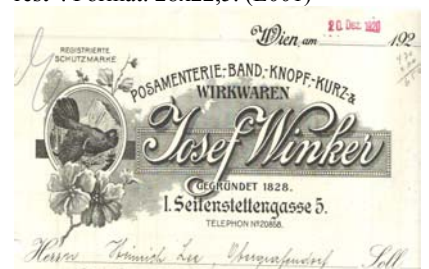
Abb. der Schutzmarke (Auerhahn vor Berg). Steuermarke 20 Heller aufgeklebt. Abheftlochungen, Knickfalten, gering fleckig, Kleberrest. Format: 28x22,5. (E001)

Unsere 6. Präsenzauktion veranstalten wir am 19.09.2009. Gerne nehmen wir auch Ihre Einlieferung zur Auktion entgegen. Sprechen Sie mit uns!