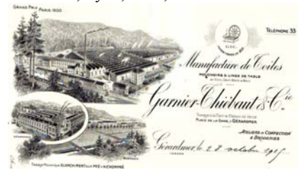
Los 641 Ausruf: 25 € Alte Lederkollegmappe mit Rechnungen, Kuverts, meist Raum Dortmund und Berlin, ca. 1900

U.a. aus Cernay, Lille, Armentières, Gérardmer, Lyon, Paris, Brüssel.