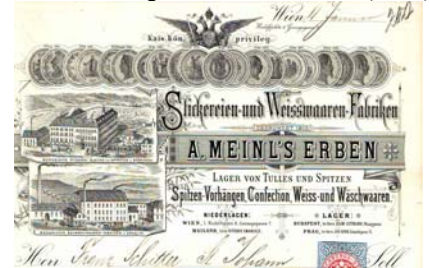
Abbildung der Fabrikanlagen in Bäringen und Graslitz, Doppeladler, Medaillen, aufgeklebter K.K. Rechnungs-Stempel über 5 Kreuzer. Knickfalten, gering fleckig, kleine Abheftlochungen. Format: 28,5x22. (E001)