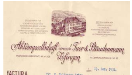
Los 639 Ausruf: 12 € Zweibrücken: Albrecht Albert, Fär- berei und chem. Reinigung, 1904

Factura mit kleinerer Abbildung des Geschäftshauses mit Eisenbahn, dahinter Berglandschaft. Knickfalten, gering fleckig, Abheftlochung. Format: 27,5x21,5. (E001)