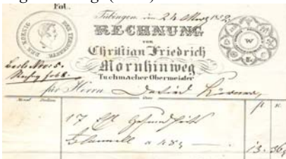
Abbildung von Medaillen. Knickfalten, gering fleckig. Format: 21x17. Seltener Regionalbeleg. (E001)