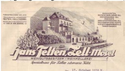
Los 634 Ausruf: 12 € Znojmo: F. Jak's a spol, 1905

Abbildung des Weingutes, dahinter Weinberg, Wappen. Abheftlochungen, Knickfalten, gering fleckig. Format: 29x21. (E001)