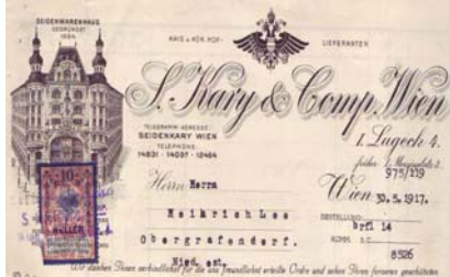
Abbildung des Seidenwarenhauses gegr. 1864, Doppeladler, aufgeklebter Stempel-Marke über 15 Heller. Knickfalten, gering fleckig, Abheftlochungen. Format: 28x22. (E001)

Los 622 Ausruf: 12 € Wien III/2: J. Wolf Fabrik chem. techn. Artikel, 1895