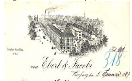
Abbildung des Firmenkomplexes vor der Silhouette der Stadt. Kleine Abheftlochungen, Knickfalten, oben leicht eingerissen. Format: 22x29,5. (E005)

Los 631 Ausruf: 15 € Würzburg, Portland-Cement-Fabrik Karlstadt a. Main vorm. Ludwig Roth Aktien-Gesellschaft, 1900