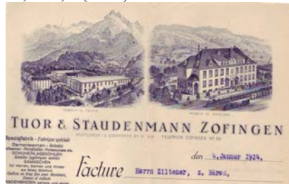
Los 637 Ausruf: 12 € Zofingen: Tuor & Staudenmann, Spezialfabrik für Damentaschen Schuhelagesohlen, 1924

Zweisprachige (Deutsch/Franz.) Facture mit Abbildung des Geschäftshauses mit Eisenbahn, dahinter Berglandschaft. Knickfalten, gering fleckig. Format: 27,5x21,5. (E001)