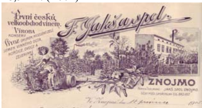
Los 635 Ausruf: 13 € Zofingen: Tuor & Staudenmann, Spezialfabrik für Schuheinlegesohlen- Gamaschen- & Wadenbindenfabrik, 1919

Abbildung des Geschäftshauses, Frau in Landstracht auf einem Fass sitzend, Feld mit Ölfrüchten (?). Aufgeklebt Steuermarke über 2 Heller, 1898. Abheftlochungen, Knickfalten, gering fleckig. Format: 28,5x22. (E001)