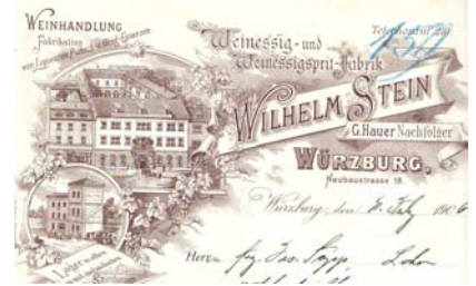
Abbildung des Geschäftshauses mit Produktionsstätten, florale Elemente durch zahlreich Reben. Kleine Abheftlochungen, Knickfalten. Format: 22,5x29. (E005)

Los 630 Ausruf: 10 € Würzburg: Ebert & Jacobi, Weinhandlung 1907