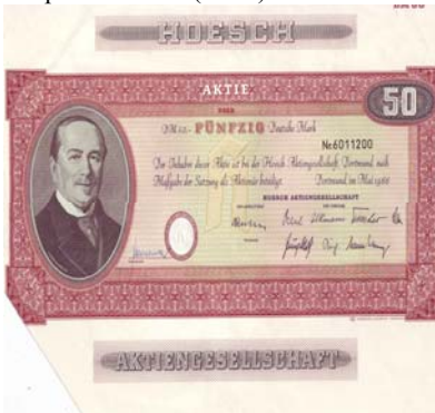
Los 761 Ausruf: 140 € Houbenwerke AG, Aachen 1.4.1923, 1.000 RM, # 11752

Eckschnitt-Entwertung. VF. Format: 30x21. Die Verbindung der Dynastie Hoesch zur Eisenindustrie gehen bis in das 17. Jahrhundert zurück. Ihre Hammer- und Hüttenbetriebe errichtete die Familie jeweils dort, wo die Standortverhältnisse eine günstige Entwicklung versprachen. Von den alten Betriebsstätten in der Eifel wurden die Betriebe 1846 angesichts knapper werdenden Rohstoffe (Erz u. Holzkohle) in die Nähe der Steinkohle nach Eschweiler verlagert. Leopold Hoesch gründete zusammen mit Verwandten 1871 in Dortmund als oHG ein Eisen- und Stahlwerk. Daraus resultierte 1873 die Eisen- und Stahlwerk Hoesch AG. 1899 wurde mit dem Erwerb der Gewerkschaft ver. Westphalia in Dortmund eine eigene Kohlengrundlage geschaffen. 1930 Verschmelzung mit dem Köln-Neussener Bergwerksverein (früher Kölner Bergwerksverein), 1938 Umfirmierung in Hoesch AG. 1952 auf alliierte Anordnung zeitweise in die drei Nachfolgesellschaften Hoesch Werke AG, Altenessener Bergwerks-AG und Industrierwerke AG aufgespalten. 1992 vom Konkurrenten Krupp übernommen. Mit Portrait-Vignette des Firmengründers Leopold Hoesch. (E018)