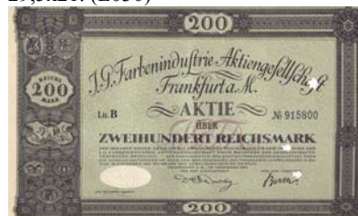
Los 763 Ausruf: 40 € Irak - Staatsanleihe, 100 Dinar; ca. 1980

Dekorative Gestaltung. Gegründet 1925 durch Fusion der damaligen Chemie-Branchenriesen. Große Verstrickungen im Dritten Reich. Faks.-Unterschrift Dr. Carl von Duisberg 1925/26). EF, Formate: 29,5x21. (E030)