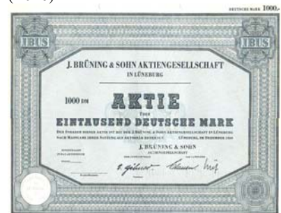
Los 765 Ausruf: 120 € Junker & Ruh-Werke AG, Karlsruhe, 7.1921; 1.000 M; # 7952

1848 als Zigarrenkisten und Zigarrenwickelformen-Fabrik gegründet. AG seit 1898, Sitzverlegung 1918 nach Berlin und 1921 nach Potsdam. Vile Zweigwerke. 1922 Holding „N.V. Cuba“ in Den Haag, die das gesamte Kapital sowie die benötigten Rohstoffe lieferte. Diese Holding wurde 1927 wieder aufgehoben, 1932 der Sitz zum Hauptwerk nach Lüneburg verlegt. Nunmehr wurde auch Sperrholz für den Schiffsbau, Innenausstattung, Möbel- und Flugzeugbau gefertigt. 1967 Umwandlung in „Bus-Werke GmbH“. Perforierter Kuponbogen. Äußerst selten. UNC, Format: 29x22. (E026)