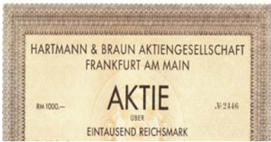
Los 760 Ausruf: 15 € Hoesch AG, Dortmund, Mai 1966, 50 DM, # 6011200

Eckschnitt-Entwertung. VF. Format: 30x21. Die Verbindung der Dynastie Hoesch zur Eisenindustrie gehen bis in das 17. Jahrhundert zurück. Ihre Hammer- und Hüttenbetriebe errichtete die Familie jeweils dort, wo die Standortverhältnisse eine günstige Entwicklung versprachen. Von den alten Betriebsstätten in der Eifel wurden die Betriebe 1846 angesichts knapper werdenden Rohstoffe (Erz u. Holzkohle) in die Nähe der Steinkohle nach Eschweiler verlagert. Leopold Hoesch gründete zusammen mit Verwandten 1871 in Dortmund als oHG ein Eisen- und Stahlwerk. Daraus resultierte 1873 die Eisen- und Stahlwerk Hoesch AG. 1899 wurde mit dem Erwerb der Gewerkschaft ver. Westphalia in Dortmund eine eigene Kohlengrundlage geschaffen. 1930 Verschmelzung mit dem Köln-Neussener Bergwerksverein (früher Kölner Bergwerksverein), 1938 Umfirmierung in Hoesch AG. 1952 auf alliierte Anordnung zeitweise in die drei Nachfolgesellschaften Hoesch Werke AG, Altenessener Bergwerks-AG und Industrierwerke AG aufgespalten. 1992 vom Konkurrenten Krupp übernommen. Mit Portrait-Vignette des Firmengründers Leopold Hoesch. (E018)